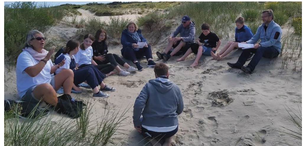
Beim Sonntagsgottesdienst in den Dünen.